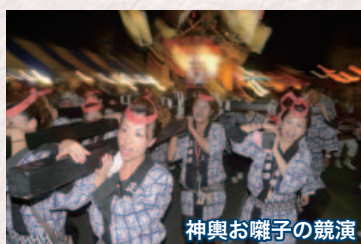
神輿お囃子の競演