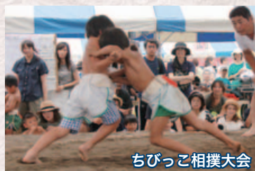
ちびっこ相撲大会